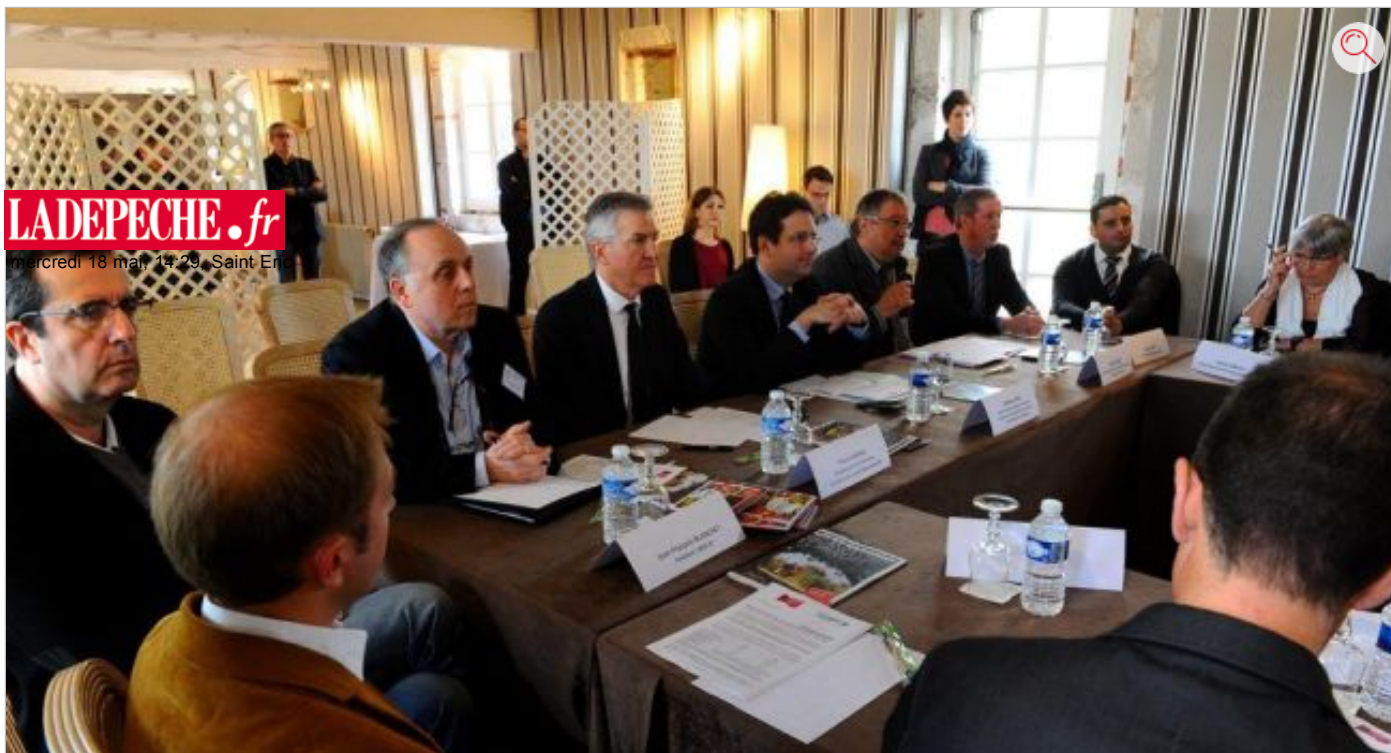
Tous les acteurs de la filière touristique vont contribuer à poser un premier diagnostic.

Les états généraux du tourisme, qui vont s'ouvrir début mai, doivent fixer la feuille de route pour les dix années à venir. Avec une idée forte, faire du département une destination phare.